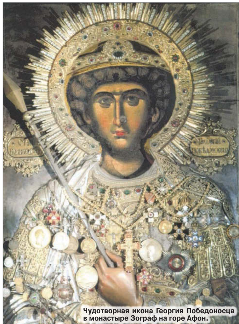
Чудотворная икона Георгия Победоносца в монастыре Зограф на горе Афон.

В царствование Льва Мудрого, императора Греческого (в 911 году), родные три брата, по имени Моисей, Аарон и Иоанн, родственники Юстиниана Великого, в чувстве особенной любви к Богу решились оставить мир, славу и знаменитость рода своего и принять на себя ангельский образ. Чтб вернее отразить от себя приражения демонских искусов и умертвить страсти собственной плоти, они избрали для того глубокое уединение и водворились в афонской пустыне, именно близ нынешнего Зографа. Вскоре по прибытии своем сюда они устроили небольшую церковь и не знали кому и в чье имя посвятить ее, потому что каждый из них предлагал такого из святых, к которому имел особенное усердие. В предупреждение несогласия и споров братской любви они наконец решились обратиться с молитвою к Богу и просить, чтоб Он Сам назначил, кому посвятить их небольшую церковь и чью ико-