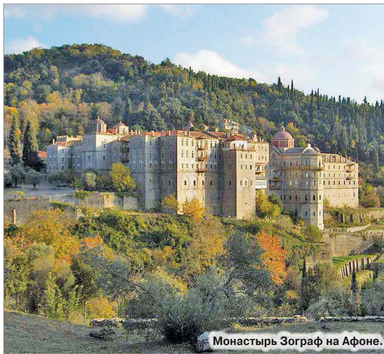
Монастырь Зограф на Афоне.

С тех пор чудеса начали беспрестанно совершаться от великомученической иконы, так что народ во множестве стекался в Зограф на поклонение святому Победоносцу».