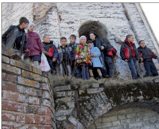
На монастырской стене.