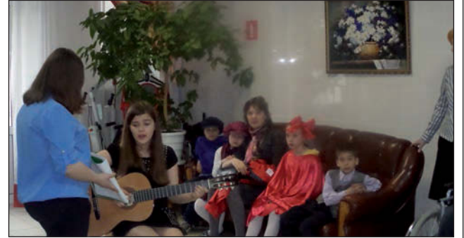
Пасхальное поздравление учащихся Воскресной школы.