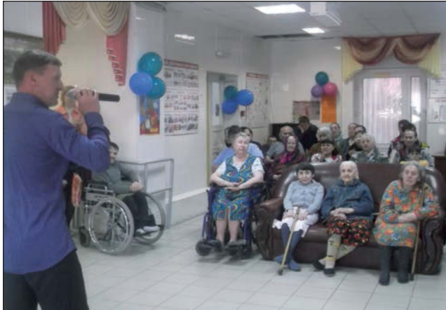
Поет Константин Алешин.