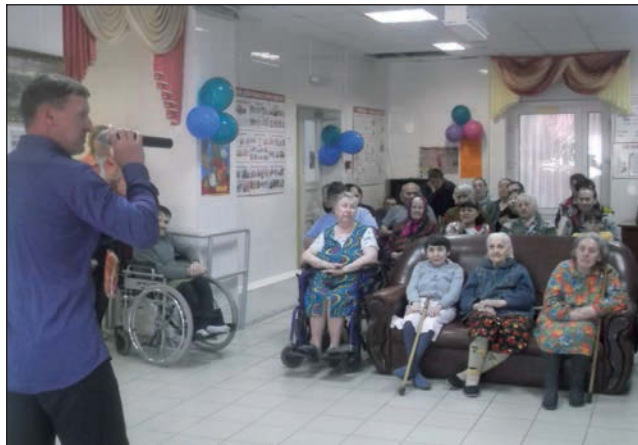
Поет Константин Алешин.