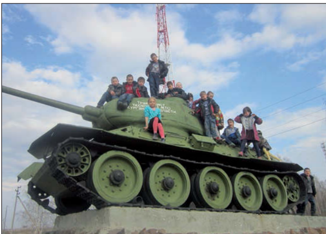
Знакомство с военной техникой.