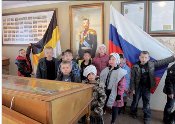
Как мы послужим России, покажет время.