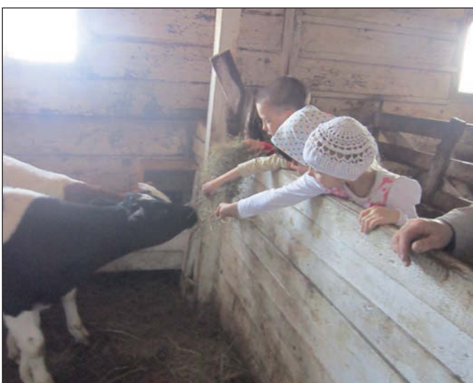
«Какие маленькие коровы!»