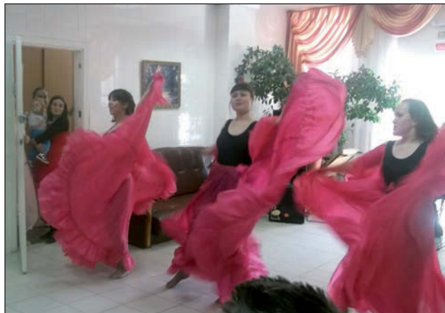
Танцевальный коллектив «Фьюжен».