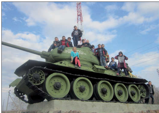
Знакомство с военной техникой.