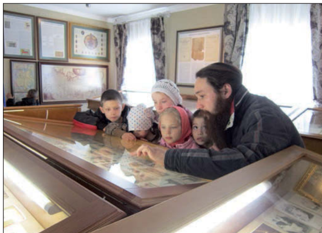
В монастырском музее.