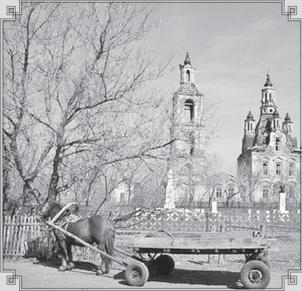
Фроло-Лавровская церковь села Белоярского, Курганская область.