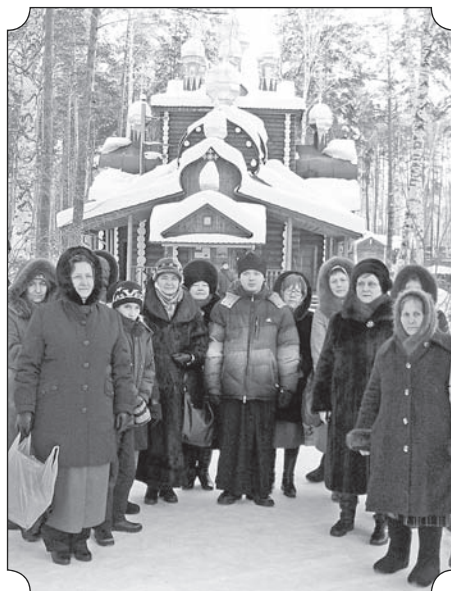
В мужском монастыре в честь Святых Царственных Страстотерпцев на Ганиной Яме, близ Екатеринбурга.

Сейчас вера возрождается. На мой взгляд, наша русская вера — един-