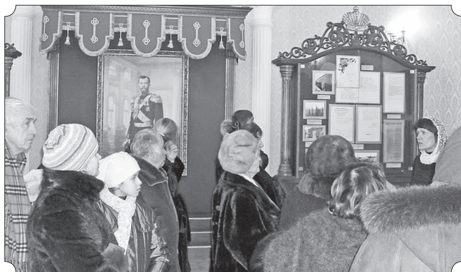
В Храме-на-Крови во имя Всех святых, в земле Российской просиявших, г. Екатеринбург.