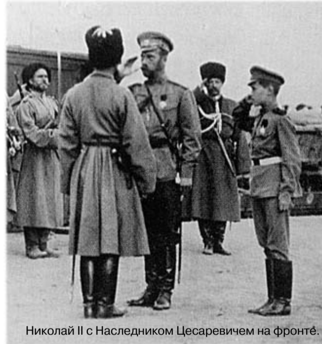
Николай II с Наследником Цесаревичем на фронте.

Наш Царь был Божий помазанник, не привыкший ко лжи. Наши прадеды ещё в 1613г. принесли клятву верности Царю и Отечеству. Но в 1918г., забыв про это и про своего Небесного Творца, народ дал себя обмануть. Забыл расхожую поговорку: «Без Бога ни до порога.» Взамен мы получили «вождевленную свободу», не зная, как её употребить, как быть свободным от государства, от