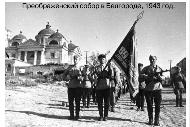
Преображенский собор в Белгороде, 1943 год.

семьи, от окружающих людей. А главное – от Бога. Потом мы запомнили, что Великую Отечественную войну выиграли с Божьей помощью и, даже сейчас не все знают и признаются в этом. Мы надеемся, что прогресс и наши знания всё свершат и мы будем процветающей нацией. Забыли, что наша держава – Советский Союз, рассыпалась вмиг, как песочный дом, потому что создавая, мы не прибегли к помощи своего Создателя. Но Русь, шатаясь, всё же стоит, Русь православная! Это и злит наших врагов – служителей антихриста. Без веры мы рабы, вера оживляет дух, даёт настроение, силы на созидание.