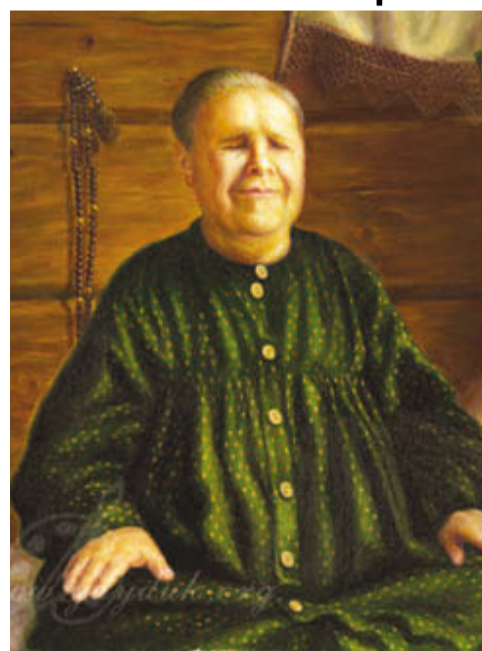
Портрет святой праведной Матроны Московской

Матронушка, в облачке своего крещенского благоухания, через всю жизнь пропорхнула, как птичка Божия.