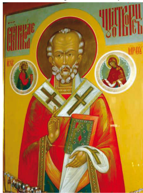
Икона святителя Николая Чудотворца, который спешит на помощь нам грешным, просящим у него заступничества.

А спас меня святитель Николай Чудотворец в образе пассажира, сорвавшего стоп-кран. Я с благодарностью вспоминаю своего дедушку, который вселил в меня православную веру, веру в Господа и подарил икону свя-