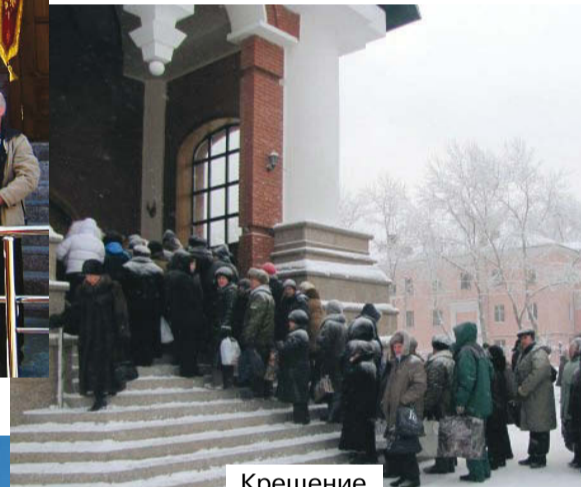
Крещение. 19 января 2011 года.