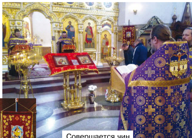
Совершается чин Торжества Православия.

Прибегаем ныне к святому великомученику Георгию, предивному чудотворцу, Бога всею душою возлюбившему и милости великой от Него удостоившемуся. Услышь нас, святой великомученик добропобедный, и моли Господа от скорбей избавить нас, и не лишить нас вечных благ.