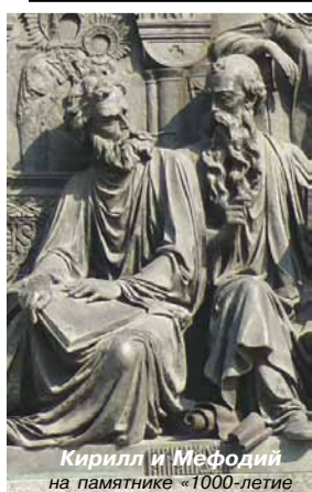
Кирилл и Мефодий на памятнике – 1000-летие России – в Великом Новгороде.