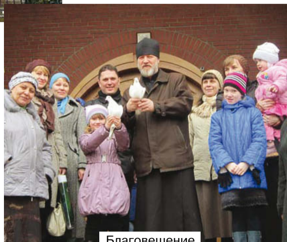
Благовещение 7 апреля 2012 года