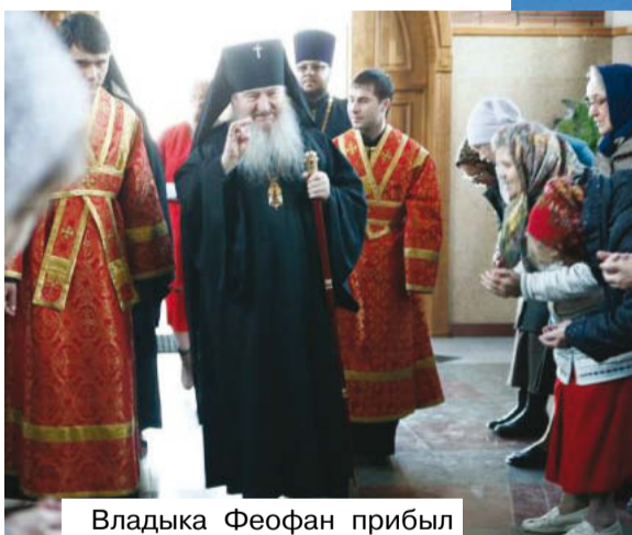
Владыка Феофан прибыл на Престольный праздник