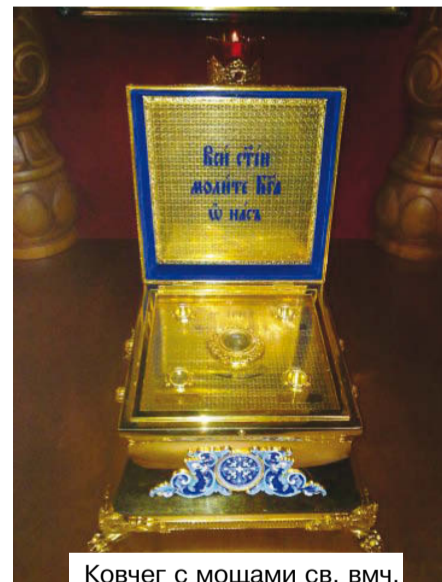
Ковчег с мощами св. вмч. Георгия Победоносца и свт. Митрофана Воронежского