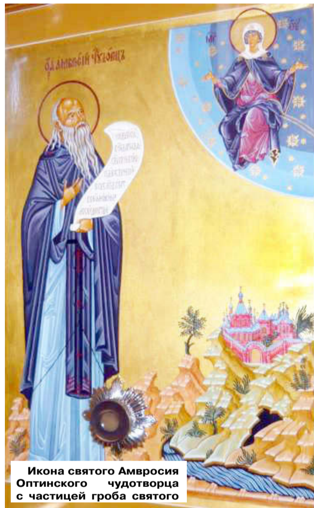
Икона святого Амвросия Оптинского чудотворца с частицей гроба святого

Преподобный Амвросий Оптинский сказал, что нужно жить с таким внутренним ощущением: всегда сознавать свою греховность, при этом не унывать и не быть беспечным, а надеяться на милосердие Божие.