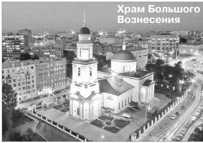
Храм Большого Вознесения